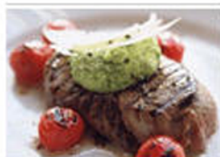
Pratique : le guide des calories