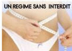
UN REGIME SANS INTERDIT Perdez 6 kg en 28 jours et 92% de réussite

ELLE / Minceur / Dossiers / Chez le kiné : on fait une cure de Cellu M6 Endermolab